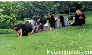
Metamorphose eines Schmetterlings