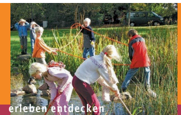
erleben entdecken erforschen erfinden