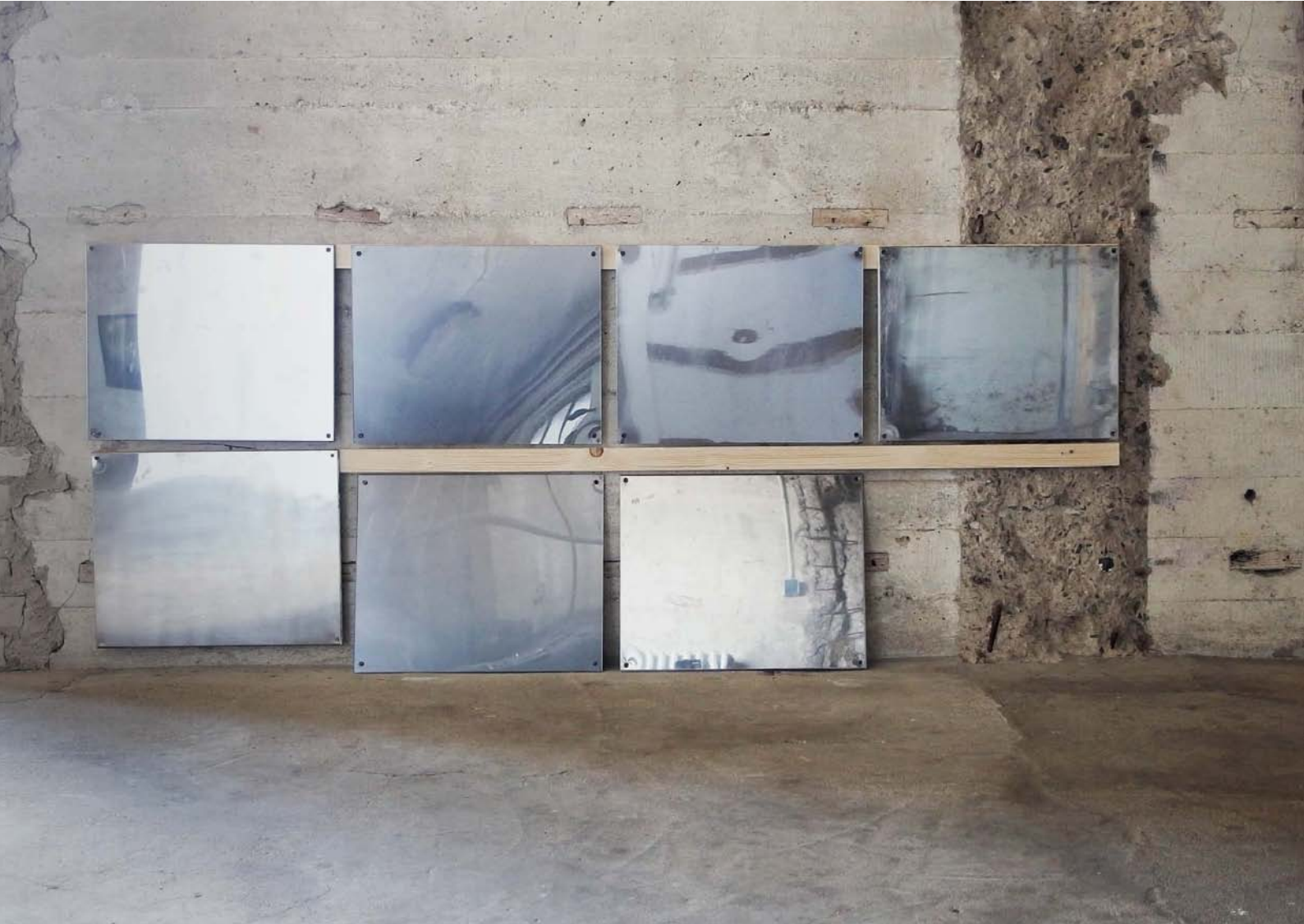
Rauminstallation Metallspiegel aus der Strafanstalt Basel und Spiegelbilder 1–10, 2008–2010, FineArt Print, entspiegeltes Glas/Glas, 40 × 50 cm Installation Metal-mirrors taken from the Basel Prison and The other room 1–10, 2008–2010, FineArt print, nonreflecting glass/glass, 40 × 50 cm