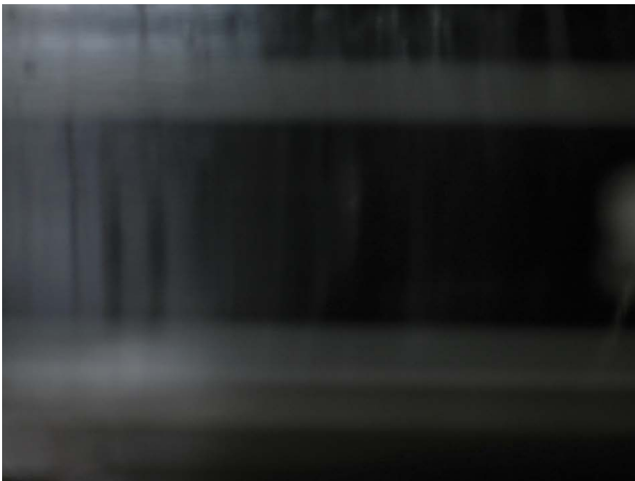
Zwischensein 3, 7, 2008 FineArt Print, Alu-Dibond, Ø 27,5 × 37 cm In between 3, 7, 2008 FineArt print, alu-dibond, Ø 27,5 × 37 cm