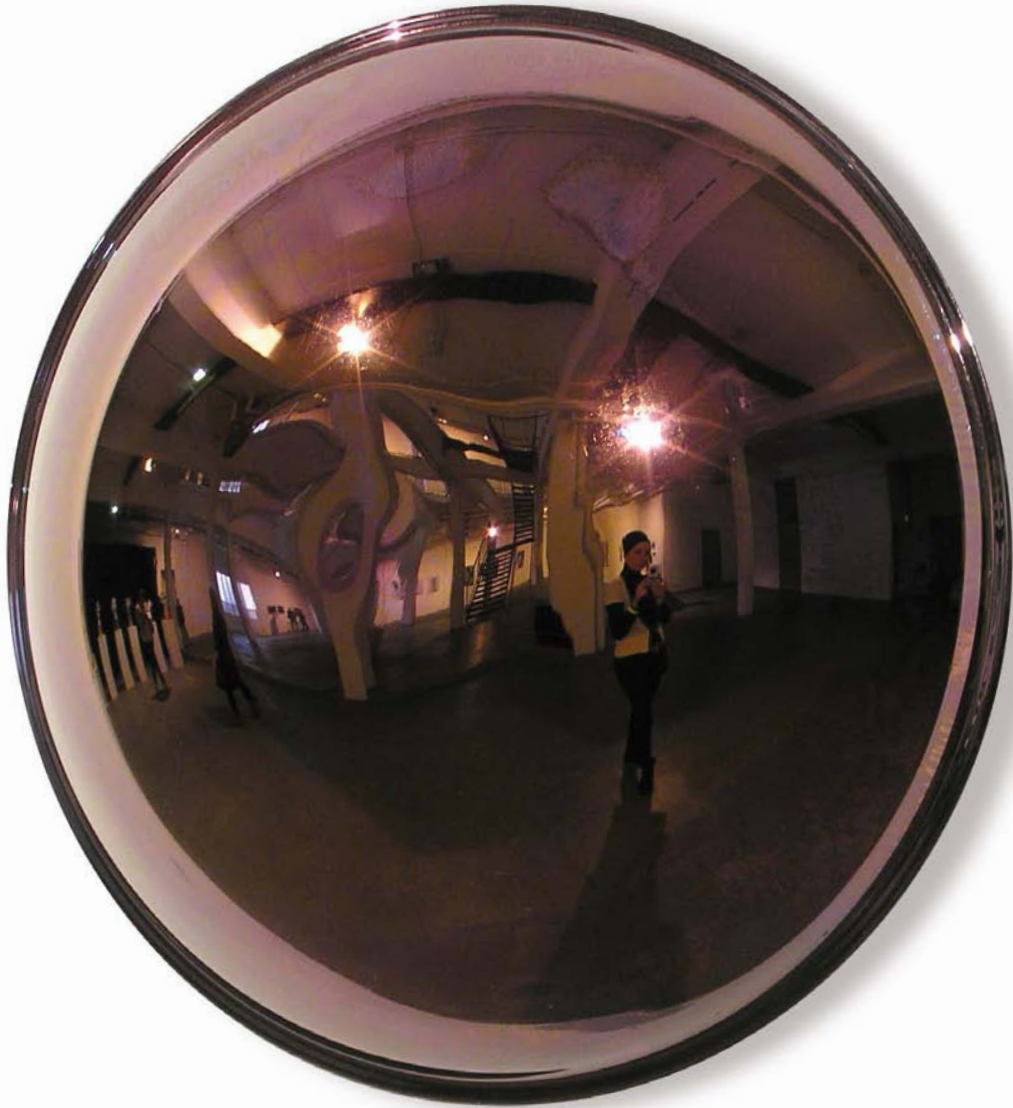
Linse, 2009 Glas geblasen, Lüster, Ø 65 × 16 cm Lens, 2009 Blown glass, lustred, Ø 65 × 16 cm