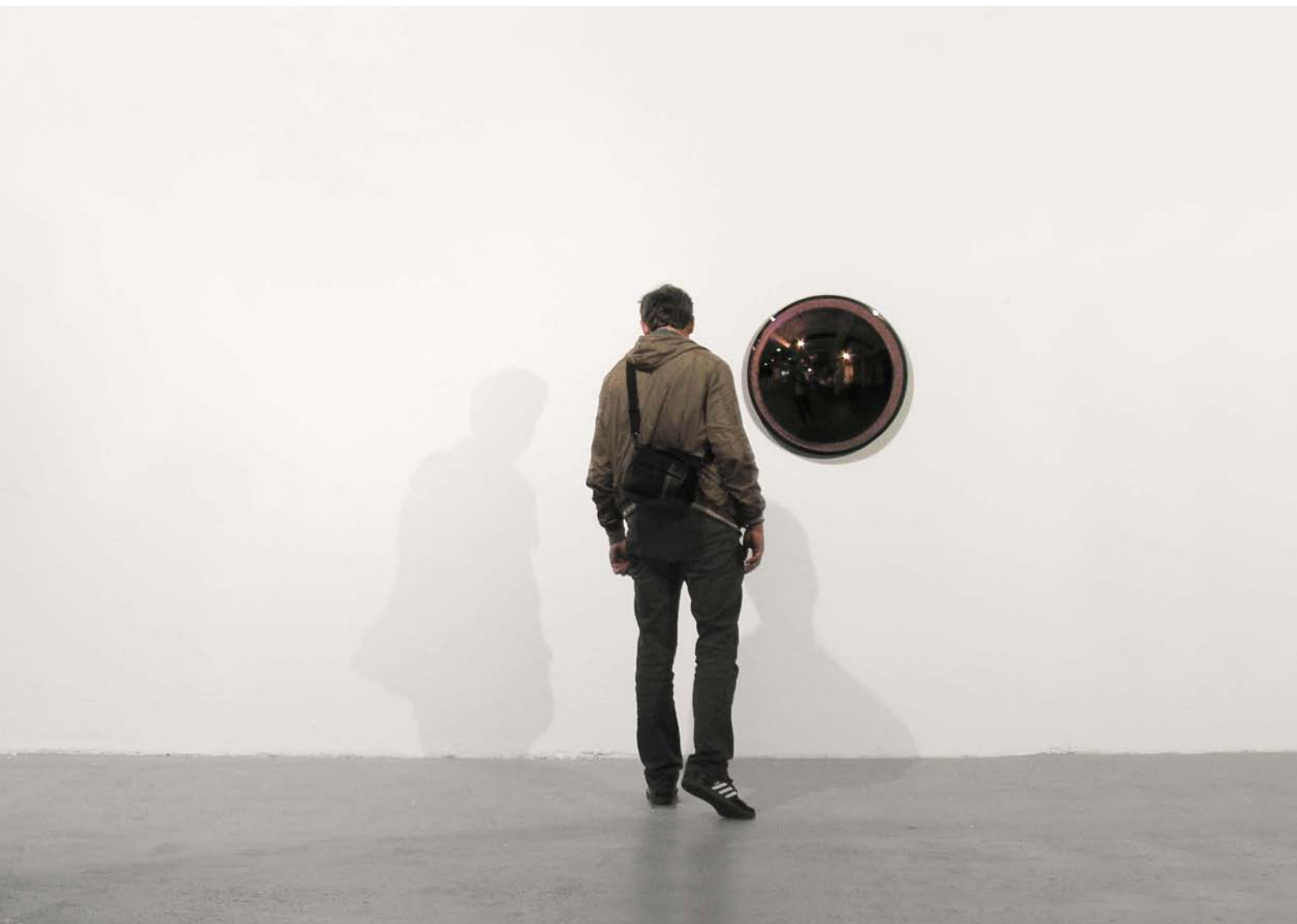
Linse, 2009 Ausstellungsansicht Lens, 2009 Exhibition view