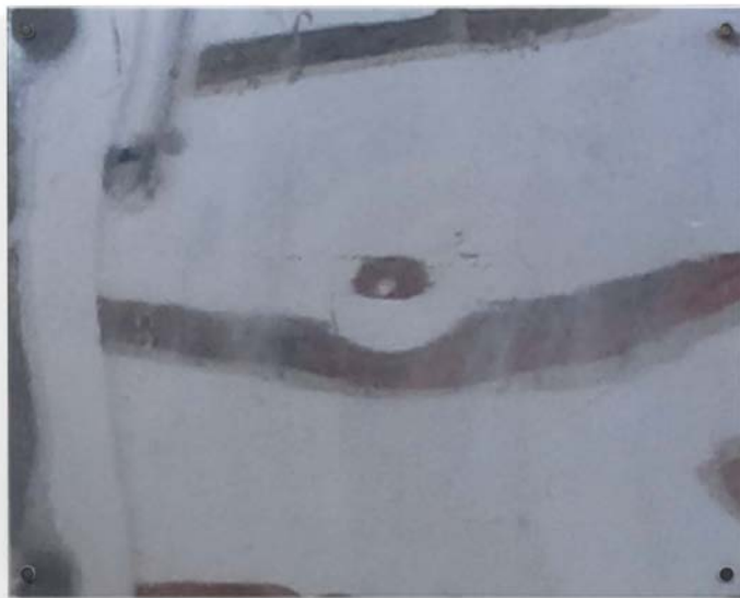
Spiegelbilder 4, 5 , 2008–2010 FineArt Print, entspiegeltes Glas/Glas, 40 × 50 cm The other room 4, 5 , 2008–2010 FineArt print, nonreflecting glass/glass, 40 × 50 cm