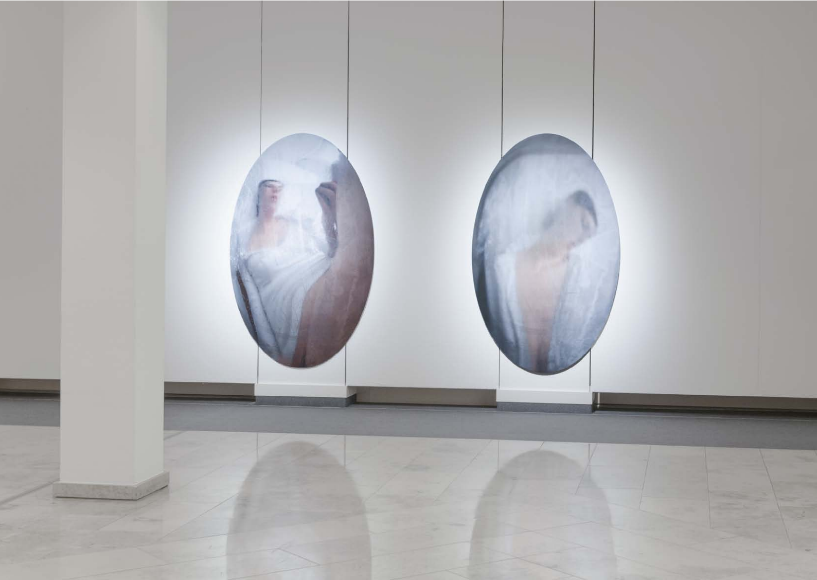
Mein Sein als Miniatur?, Sein III, II, 2011 Ausstellungsansicht, Kulturzentrum FFFZ Düsseldorf My Being as Miniature?, Me III, II, 2011 Exhibition view, Kulturzentrum FFFZ Düsseldorf