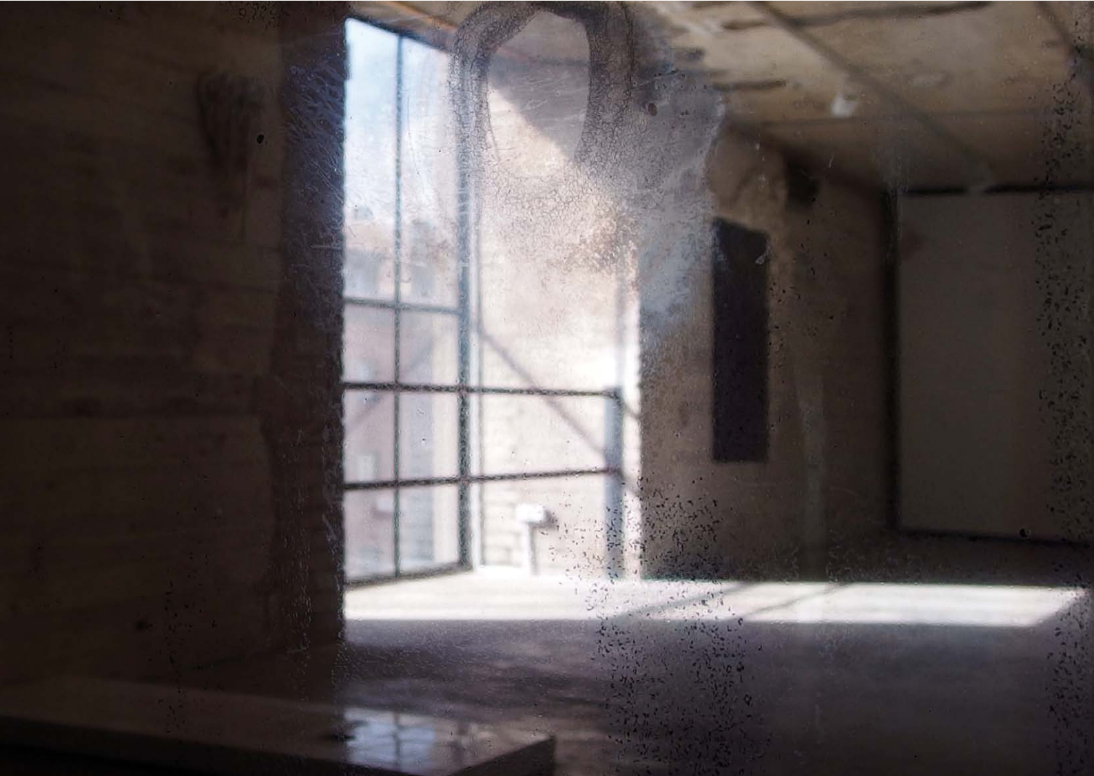
Spiegel klein , 2011 Glas, Lüster, 46 × 66 cm, Detail Mirror small , 2011 Lustrated glass, 46 × 66 cm, detail