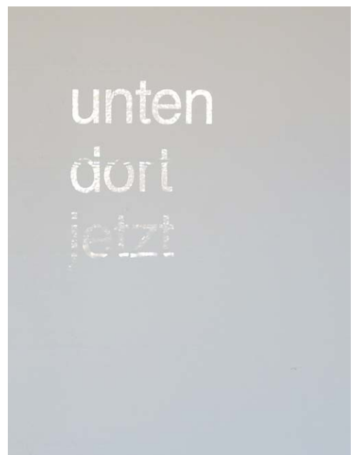
hier , 2013 Klarsichtfolie here , 2013 Polythene foil