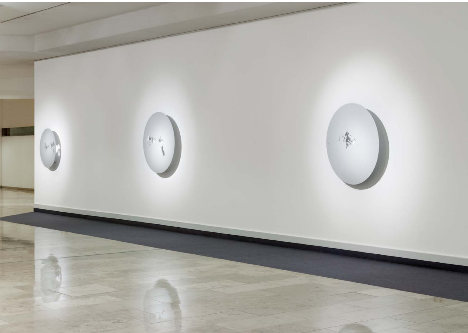
Schatten|Raum, Scheibe VII, II, VI, 2011–2012 Ausstellungsansicht, Kulturzentrum FFFZ Düsseldorf Shade And Space, Disc VII, II, VI, 2011–2012 Exhibition view, Kulturzentrum FFFZ Düsseldorf