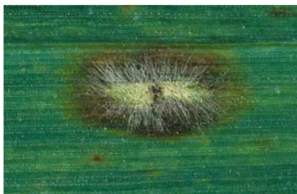
Auf dem Makrofoto in der linken Spalte erkennt man deutlich, dass der Echte Mehltau sich anfänglich

Wintergerste zeigt einen geringen Befall mit Echtem Mehltau und entsprechenden Abweh- nekrosen in Form typischer brauner Flecken.