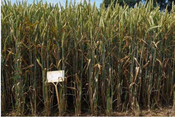
„Tobak“ ohne Fungizide Oben: Frühsaat Unten: Spätsaat

Frühsaat (Mitte September) und Spätsaat (Mitte Oktober).