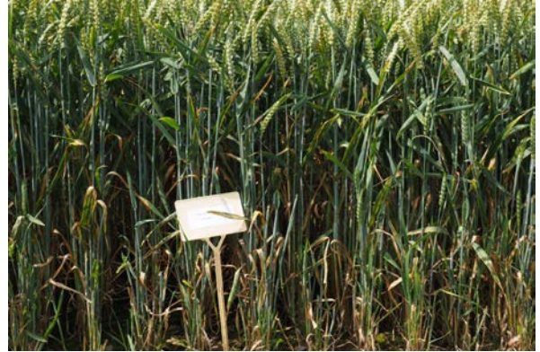
„Tobak“ mit Fungizidbehandlung Oben: Frühsaat Unten: Spätsaat