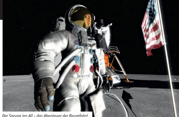
Der Sprung ins All – das Abenteuer der Raumfahrt

EINTRITT: 8,50 € (6,50 €) MULTIMEDIA: ●●●●