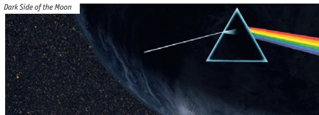
Dark Side of the Moon

Jugendschutz: Soweit keine FSK-Angabe gemacht ist, handelt es sich bei unseren Veranstaltungen um Info- und Lehrprogramme gemäß § 14 JuSchG oder um Veranstaltungen, die eine FSK-Freigabe ohne Altersbeschränkung erhalten haben.