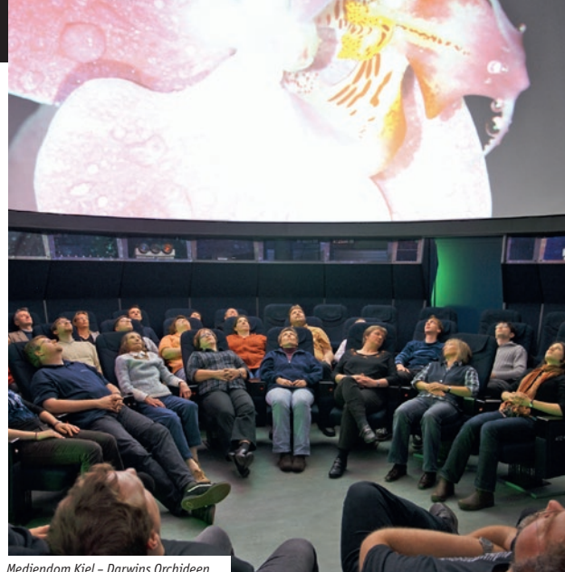
Mediendom Kiel – Darwins Orchideen

Der Mediendom ist barrierefrei eingerichtet.