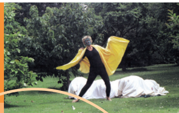
Metamorphose eines Schmetterlings

NaturSpielpädagogik entdeckt die Phänomene der belebten und unbelebten Natur im Rhythmus der »Phänologischen Jahreszeiten«. Die daraus entstehenden Fragen finden ihre Antworten durch Eigentätigkeit in Projekten.