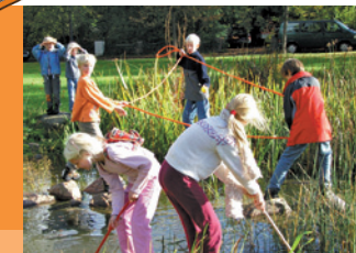
erleben entdecken erforschen erfinden