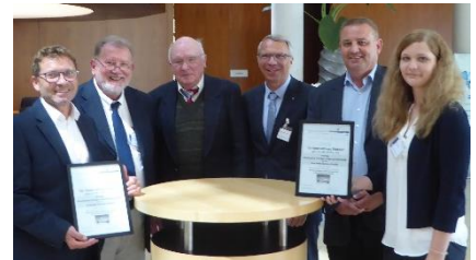
Vergabe des Horst Hartmann Preises 2019