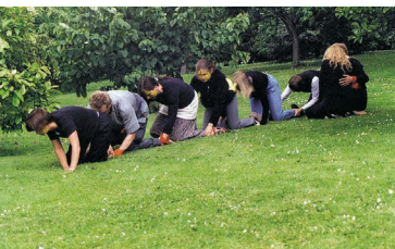
Metamorphose eines Schmetterlings