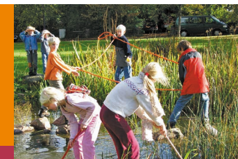
erleben entdecken erforschen erfinden